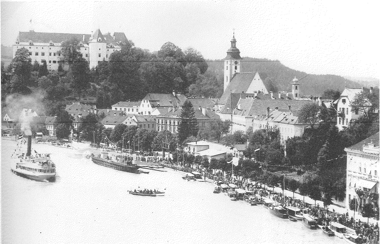
In Grein befand sich der schönste Kai der gesamten Donaustrecke.