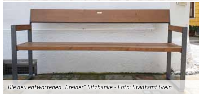
Die neu entworfenen „Greiner“ Sitzbänke

Gefallen Ihnen die neuen Bänke oder möchten Sie lieber die bisherigen „Schönbrunner“ Bänke am Stadtplatz zurück haben? Und wäre es denkbar die Bänke und Radständer auch über den Stadtplatz hinaus in Grein zu verwenden und so eine gemeinsame Gestaltung zu schaffen? Teilen Sie uns Ihre Meinung mit!