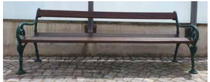
Die bisherigen „Schönbrunner“ Sitzbänke

Auf diesem Wege möchten wir gerne Ihre Meinung zu den Bänken einholen: